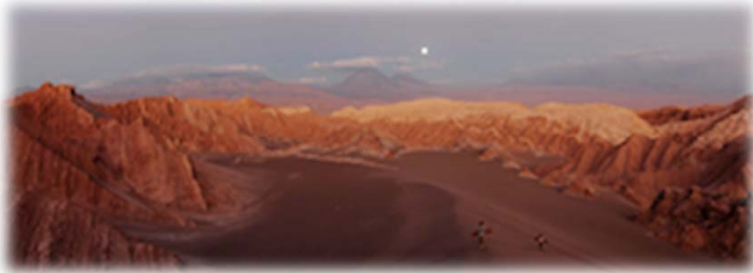
Vue sur la cordillère de sel

Situé à la limite du Tropique du Capricorne, San Pedro de Atacama est un oasis plein de charme, un village qui vit au ralenti, à l'écart du temps et du pays. D'abord habité par les Atacameños, envahi par les Incas et puis par les espagnols, le village est aujourd'hui occupé par leurs descendants, par les nouveaux venus et par les visiteurs du monde.